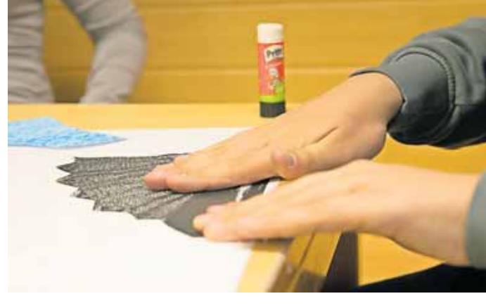
Einst dienten die Gebäude der Klinik Schönsicht (oben links) als Jagdschlösschen. Heute sollen dort Kinder von ihrer Handy-Sucht, etwa durch Maltherapie in der Gruppe, befreit werden.